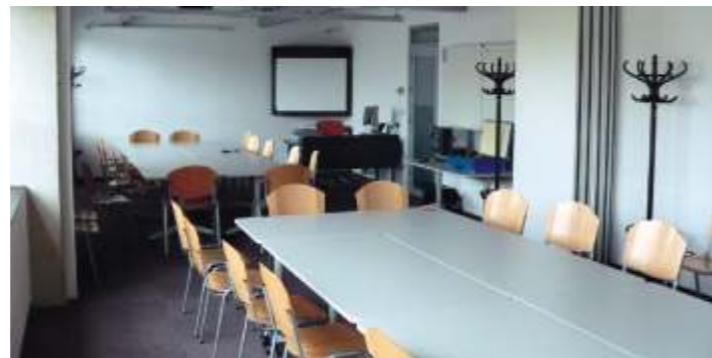
Podnikové školicí středisko OEZ

1 Stavba budovy, ve které se školicí středisko nachází, nebyla předmětem projektu